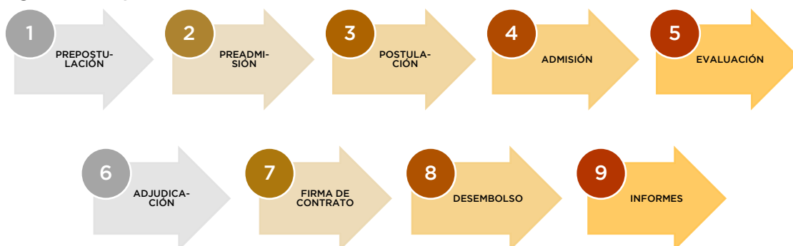
Figura 4. Etapas de la ventanilla

Una vez adjudicada la actividad CyT propuesta, se llevará a cabo la segunda fase “ Ejecución de la Actividad ” integrada por las etapas: (vii) firma de contrato, (viii) desembolso, ejecución de la actividad, (ix) presentación de los informes y fase de cierre.