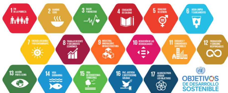
Figura 3. ODS establecidos por la ONU