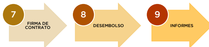
Figura 6. Etapas de la fase Ejecución

Compete a las etapas a llevarse a cabo de acuerdo al flujo siguiente: